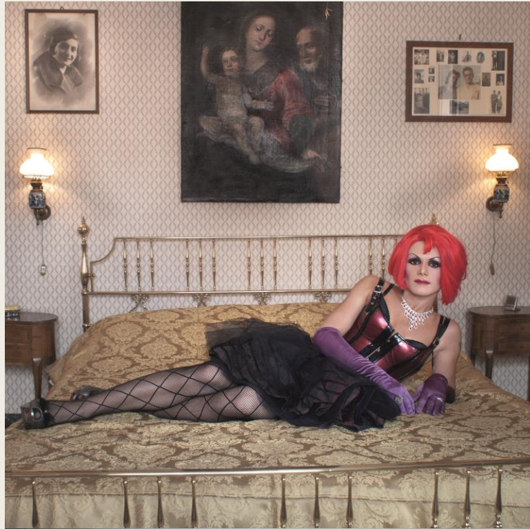
© Antonella Monzoni, Volevo essere Mina